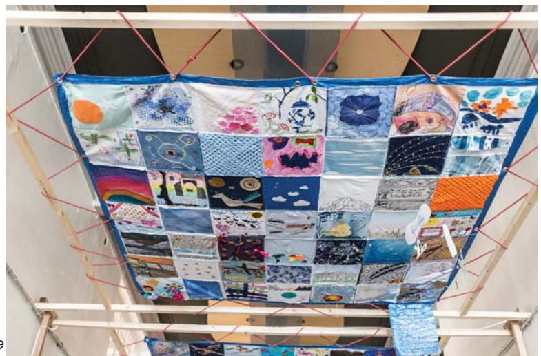
Un seul ciel, CEC La Marelle